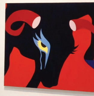
Widok z wystawy Po skórze łążą muchy Miejski Ośrodek Sztuki, Gorzów Wielkopolski, 2023