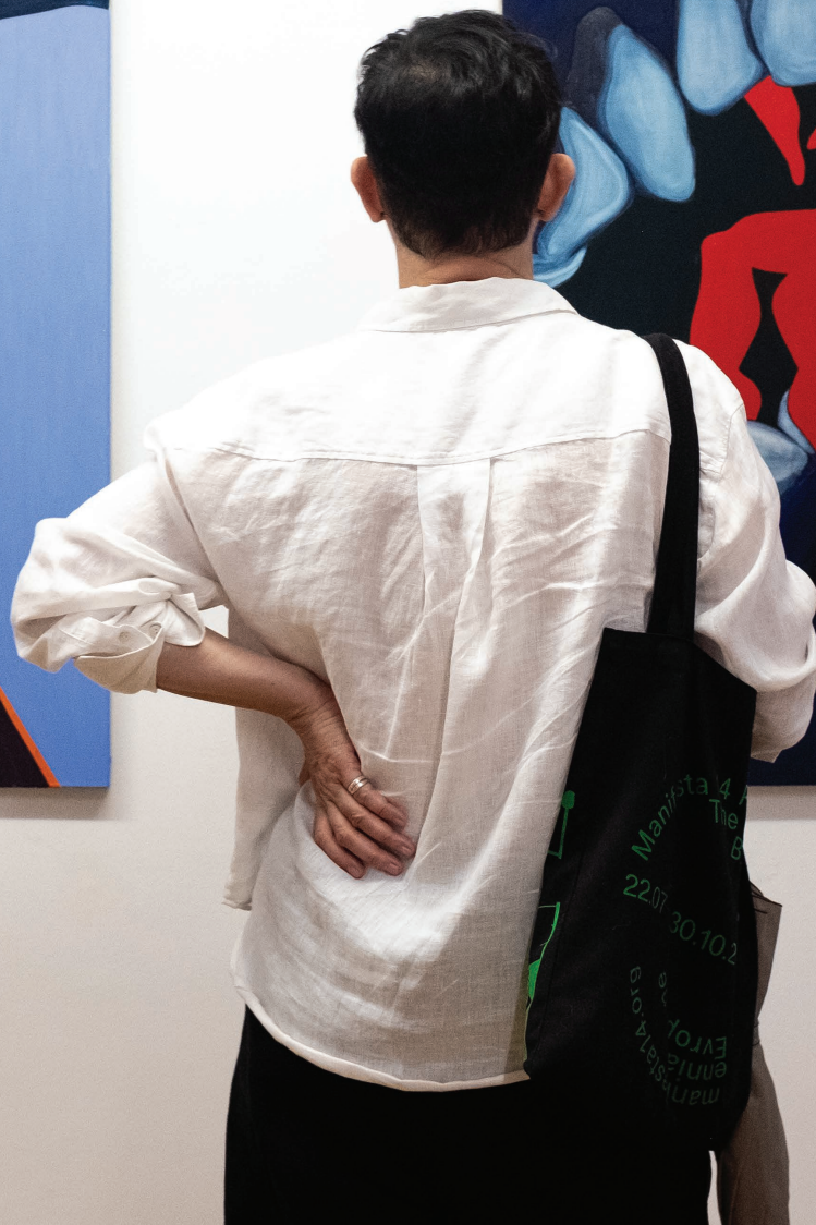
Widok z wystawy Nie pokazuj języka Galeria Turnus, Warszawa, 2024